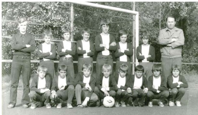
80. léta žáci UJ