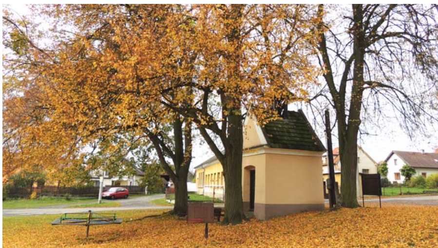
kaplička v Mirošovicích

Sázavou a okolí. V této expozici jsou k vidění exponáty pocházející z Ratají, včetně archeologických nálezů z doby bronzové. Zaměření expozice je na venkovská řemesla a zemědělství.