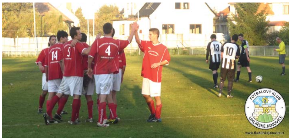
Oslava druhé branky v utkání Uhl. Janovice – Říčany

„Zpočátku to bylo takové opatrnější na obě strany,“ hodnotil utkání trenér FK Uhlířské Janovice a pokračoval: „Do šancí jsme se ale dostávali, kromě vstřelených branek jsme měli ještě čtyři další příležitosti.“