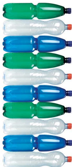
nesešlapané PET lahve 10 ks