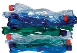
sešlapané PET lahve 10 ks